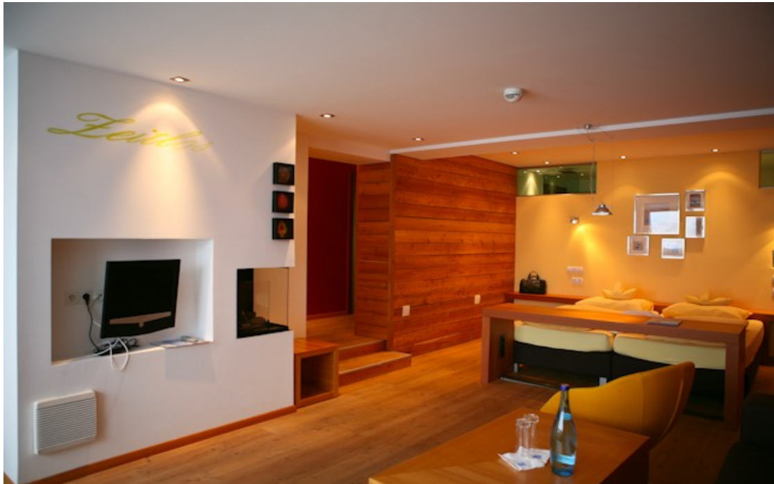
61 Zimmer (gediegen im Tiroler Landhausstil oder modern im STAR-Komfort, Foto)

Öffnungszeiten: Anfang Dezember bis 25. März sowie zweites Mai-Wochenende bis letztes Oktober-Wochenende