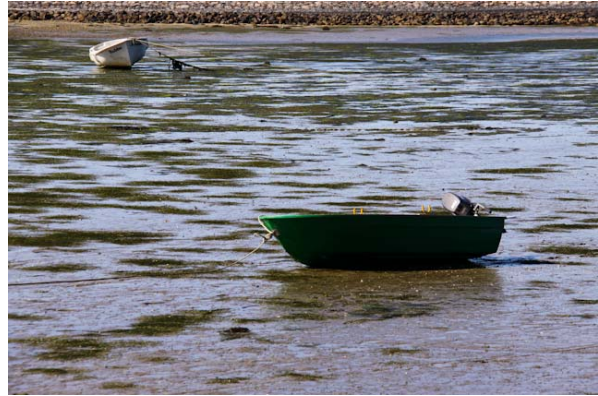
Boote in Schlafstellung: An der Nordsee zieht sich bei Ebbe das Wasser aus dem nur wenige Meter tiefen Wattenmeer kilometerweit zurück