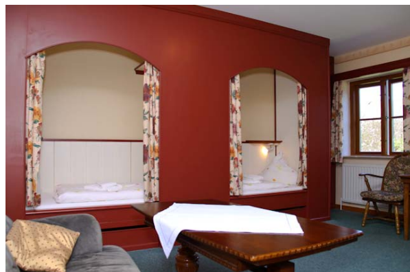
Schlafen im Schrank: in den Alkovenbetten