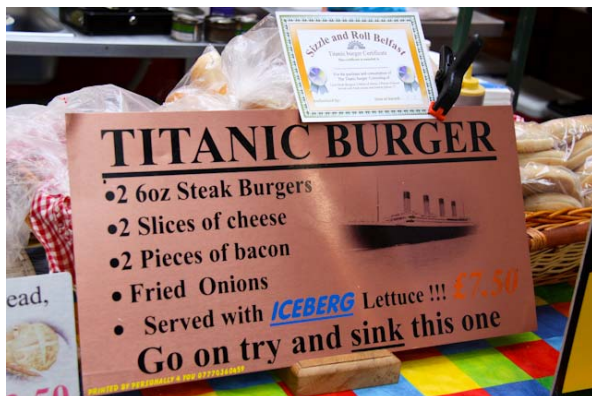
Wrack im Verdauungstrakt: der Titanic Burger, angeboten im St. George's Market, 12-20 East Bridge Street, www.discovernorthernireland.com