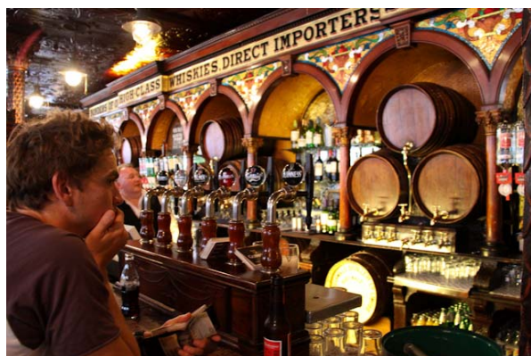
Crown Bar, 46 Great Victoria Street, www.crownbar.com