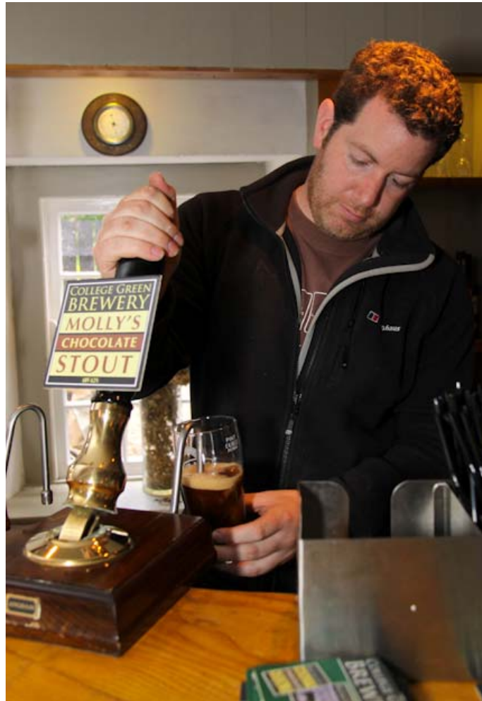
Zauberhaftes Zuckerwerk im Trunk: Molly's Chocolate Stout aus dem Hause Hilden