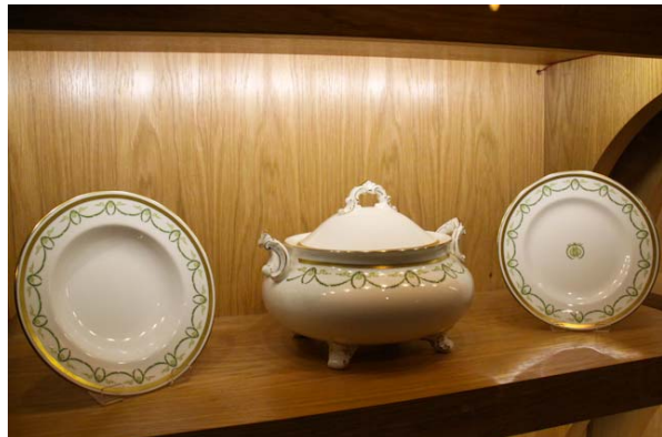
Titanic Belfast Museum, Queen's Road, Titanic Quarter, www.titanicbelfast.com

Auf welch edlem Porzellan die Finanzstarken an Bord speisten, zeigt eine Vitrine. Viele Besucher haben sich davor versammelt. Sie stellen sich vor, wie die Bediensteten im Speisesaal um die geldige Gesellschaft herumscharwenzelten und wie die so wunderbar Umschmeichelten Austern, Filet Mignon und Gänseleberpastete goutierten – bei ihrem letzten Abendmahl.