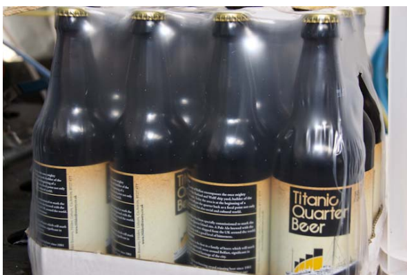
Hilden Brewery, Lisburn, Co. Antrim, www.hildenbrewery.co.uk

Auch die 1885 eröffnete und vielfach gerühmte Crown Bar in Belfast bietet Owens äußerst schmackhaftes Gebräu an. Und der junge Chef findet es prima, „auszugehen und sein eigenes Bier zu bestellen“.